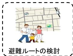
避難ルートの検討