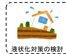
液状化対策の検討

国土交通省ハザードマップポータルサイト http://disaportal.gsi.go.jp/